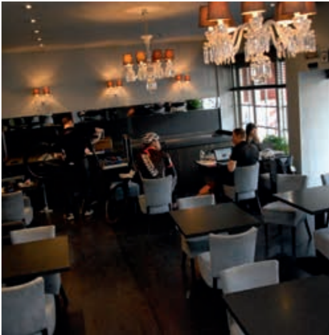
Het Center Hotel, interieur