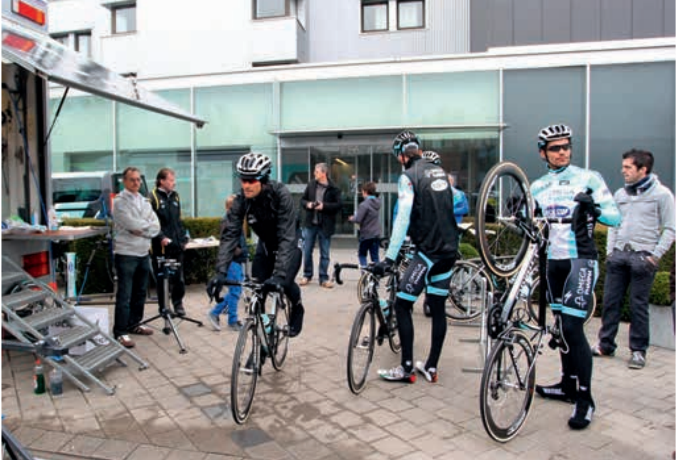
Tom Boonen voor het Kennedy Hotel