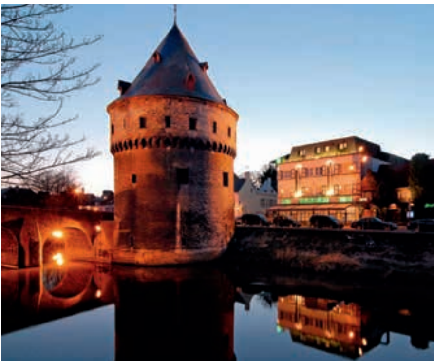
Sandton Broelhotel aan de Broeltorens