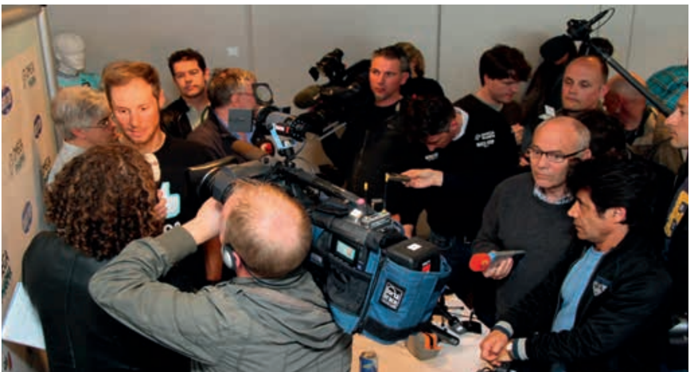
Persconferenties zorgen voor een drukte van jewelste