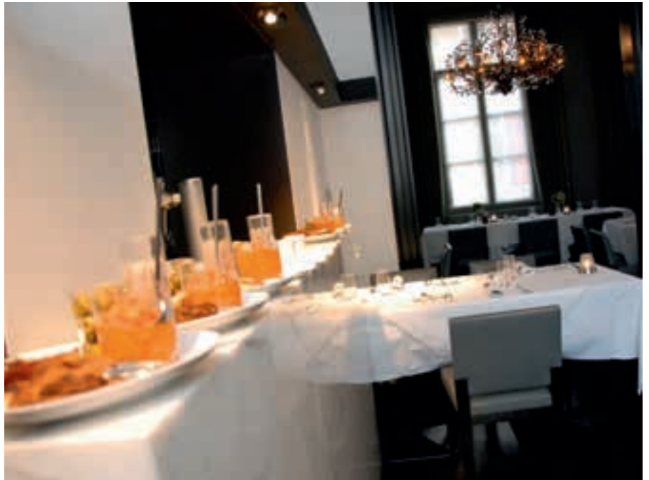
Interieur Hotel Messeyne