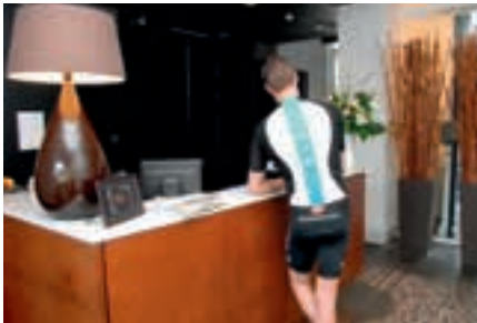
Sky was te gast in Hotel Messeyne