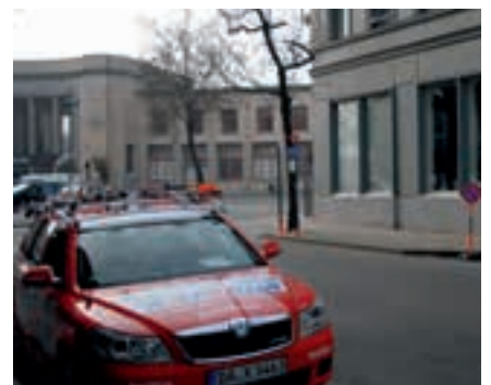
Katusha logeerde in het Parkhotel