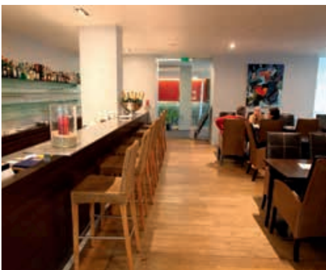
Kennedy Hotel, interieur