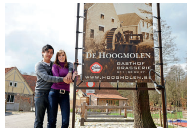
Gasthof De Hoogmolen was de uitvalsbasis van het West-Vlaamse koppeltje.

download deze brochure GRATIS op www.toerismelimburg.be